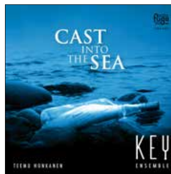
Cast into the Sea 2015