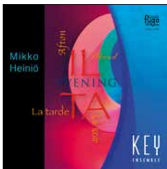
Evening – Ilta 2016