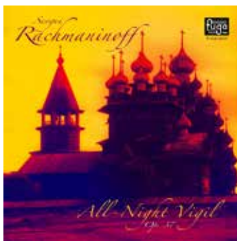
All-Night Vigil 2014

Contemporary A Cappella Recording Award 2014