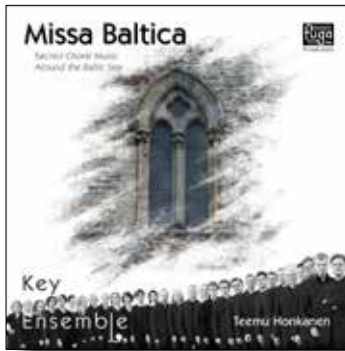
Missa Baltica 2011

Vuoden suomalainen kuoro levy 2011 Contemporary A Cappella Recording Award 2012