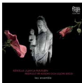
Keskellä liljain ja ruusujen – joululevy 2018